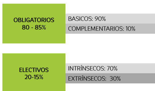
Tabla 1 Distribución de créditos en el PCAM 3

La organización del plan de estudios obedece a la clasificación y la estructura de créditos planteada en el Acuerdo 009 de 2016, emitido por el Consejo Académico de la Universi-