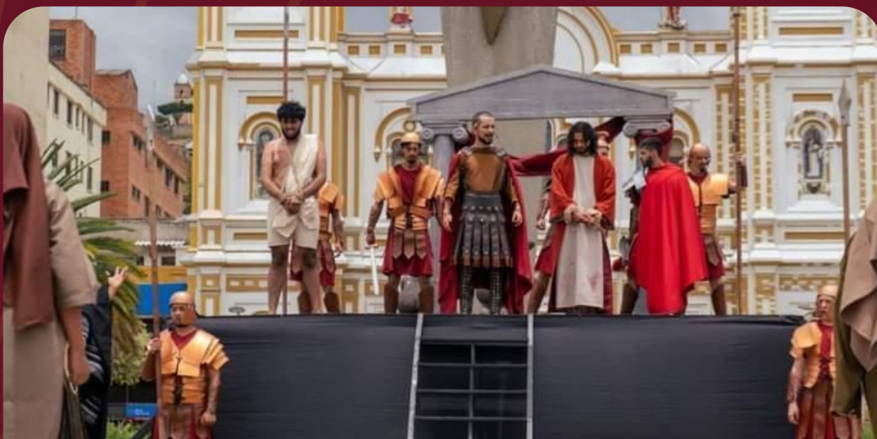
Escena de Jesús ante Pilatos. En primer plano: Barrabás, soldado, Poncio Pilatos, Jesús. Año 2022. Compañía Almateatro. Sogamoso, Boyacá.