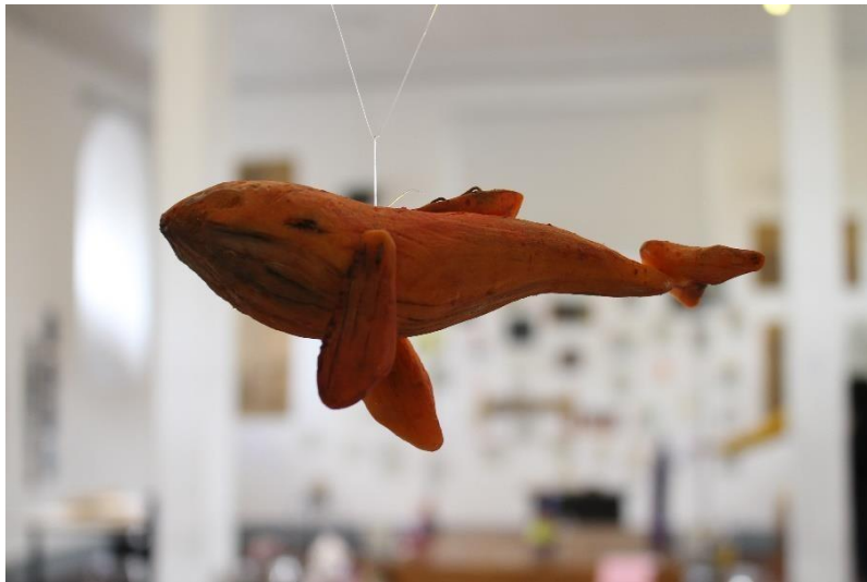
Clase INTRODUCCIÓN A LAS TRES DIMENSIONES 2023