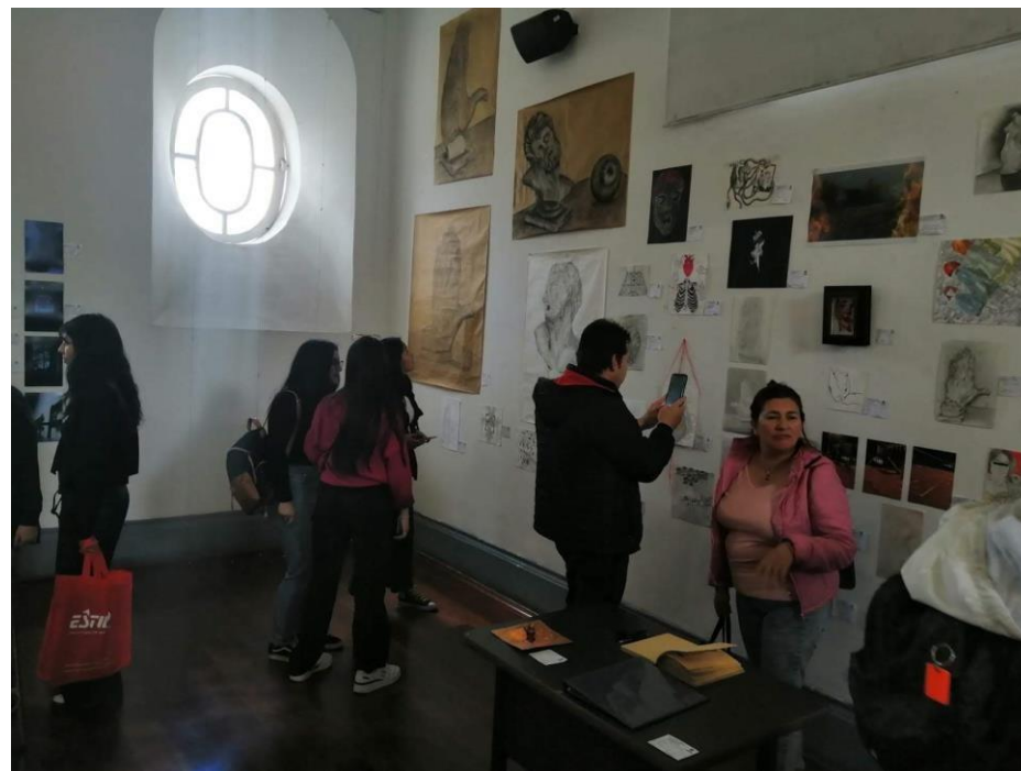
Clase ARTE Y CIUDAD 2022

EL PREPARATORIO EN ARTES PLÁSTICAS Y VISUALES NO ES GARANTÍA NI PRERREQUISITO PARA EL INGRESO DE LOS ESTUDIANTES A NIVEL DE PREGRADO EN ARTES PLÁSTICAS.