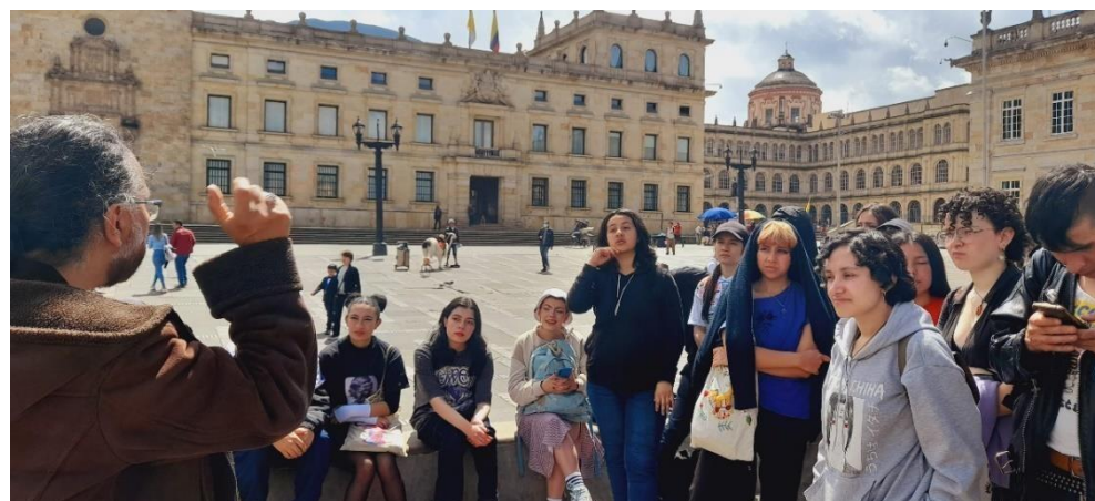
Clase ARTE Y CIUDAD 2022

El lugar, los días de clase (de lunes a sábado), y horarios asignados, pueden presentar variaciones en su construcción y ejecución de acuerdo con la necesidad de espacios requeridos y ofertados por la facultad de Artes Asab.