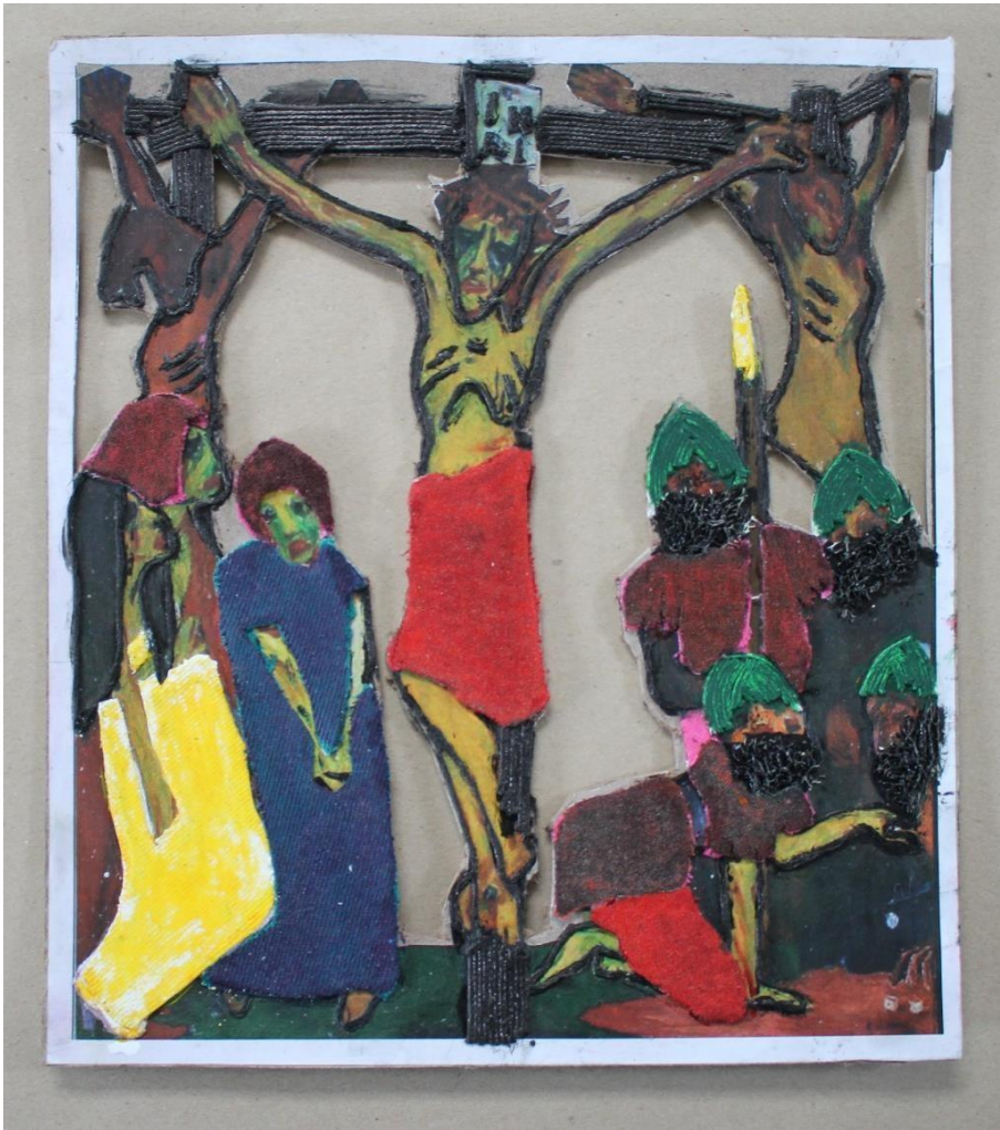
Clase APRECIACIÓN VISUAL 2022