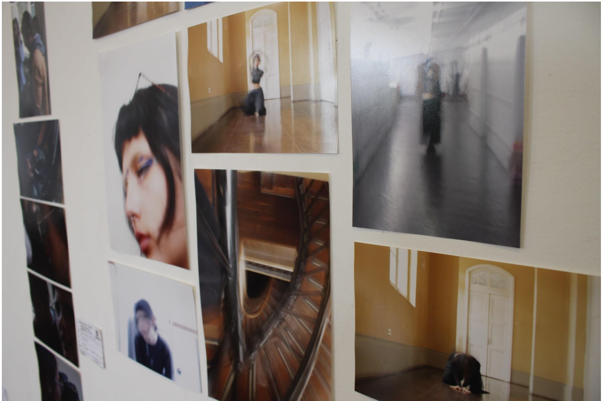
Clase FOTOGRAFÍA EXPERIMENTAL 2023